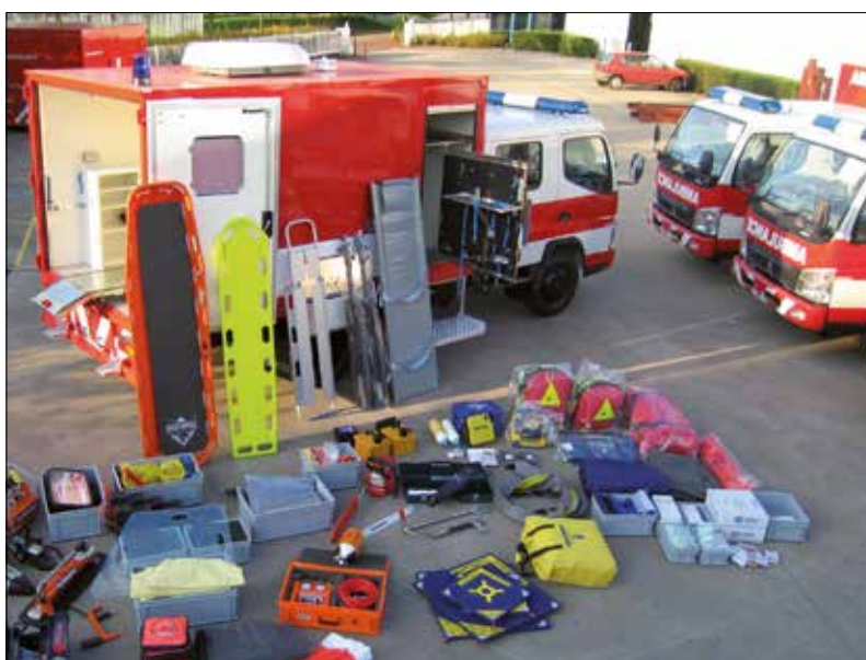
Inhoud reddingcontainer voor vervoer per vliegtuig.

Door hun uniforme inrichting kan personeel van ieder corps blind de benodigde spullen in een container van een ander corps vinden. Stress is onvermijdelijk bij rampenbestrijding. Maar naar de nodige gereedschappen zoeken, is geen stress meer. Zo blijft er meer concentratie over voor het verrichten van de taak. En daar ging het om.