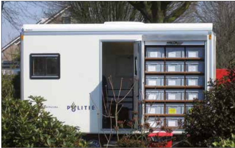
Mobiele werkplaats KLPD met E-line bakkenmagazijn en rode industriekwaliteit afvalbak.

E-line bakken worden door hun strakke vormgeving en vele accessoires (zelfklevende houders, zelfklevend magnetische vlakken, barcode stickers met notitieveld, verzegelingen, verzegelingen met barcode en embleem) minstens even vaak voor opslag-, als voor transport doeleinden gekozen.