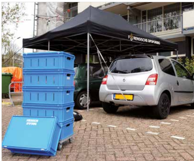
Stapelbare kisten met sleuven, snapsluiting en opdruk voor het opbergen van tenten van Forensische Opsporing.

Bewijsmateriaal archief. E-LINE bakken zijn verzegelbaar en daarom geschikt als opslagbak én als verzendeenheden.