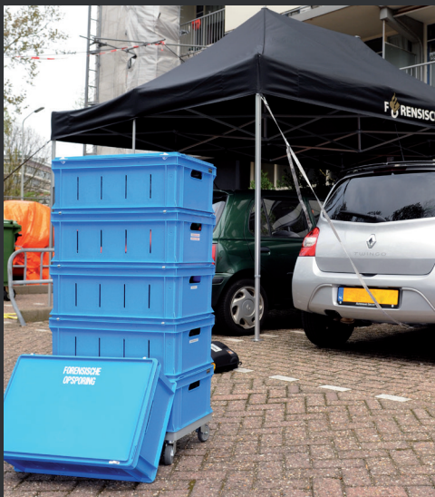
Politie en Justitie