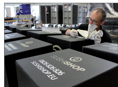
Onze bezorgboxen kunnen we voorzien van tekst of uw logo door middel van zeefdruk-ken, montage van een recla-mepaneel of een maatwerk sticker.