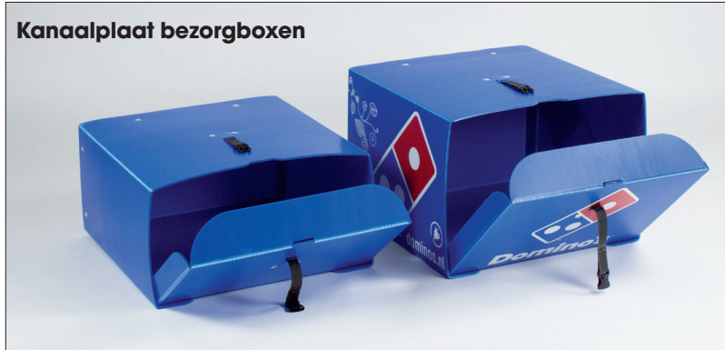
Lichtgewicht kanaalplaat Bicycle Delivery Boxen worden projectmatig geleverd in een door de klant gewenste afmeting.