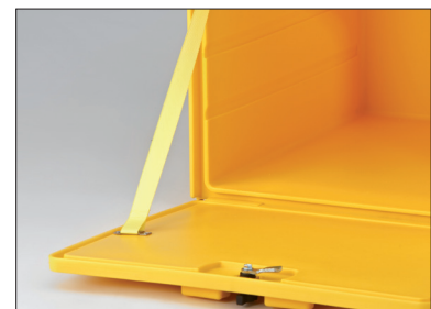
Sterke polyester dekselbe-grenzer.