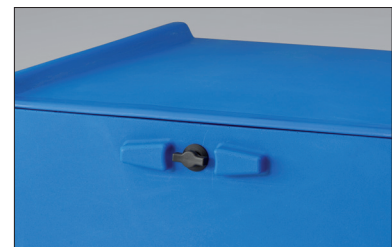
Draaisluiting, optioneel met cilinderslot, veilig weg-gewerkt.