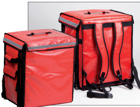
Geïsoleerde tassen met flexibel in te delen schappen.

Het is steeds lastiger medewerkers te vinden met scooterbijbewijzen omdat jongeren al vanaf 17-jarige leeftijd hun autorijbewijs mogen gaan halen. Om hierop in te spelen, heeft Engels een Bicycle Delivery Box (BDB) ontwikkeld. Zo kunnen jongeren op de fiets de goederen distribueren.