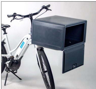
Lichtgewicht bezorgbox voor voorop de fiets.

Dankzij onze eigen ontwerp- en productiefaciliteiten kunnen wij eenvoudig een scooterbox uit kanaalplaat op maat voor u realiseren. Wij denken graag met u mee.