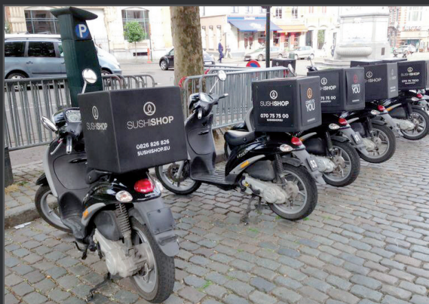
Enkelwandig en robuust