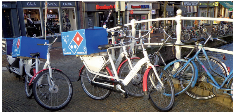
Ook geschikt voor achterop de fiets.