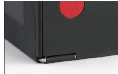
RVS scharnieras, veilig weg-gewerkt.