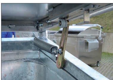
Deksel blijft open staan door veermechanisme.