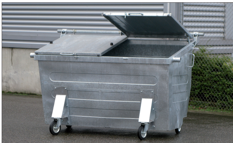
2500 liter container met stalen deksel.

Voor grote volumes, geschikt voor de gebruikelijke DIN-opnames, hebben we ook stalen afvalcontainers. Deze zijn beschikbaar voor volumes van 2000 tot 5000 liter. Ook deze containers zijn thermisch verzinkt. De deksels kunnen worden geleverd in kunststof, staal of aluminium.