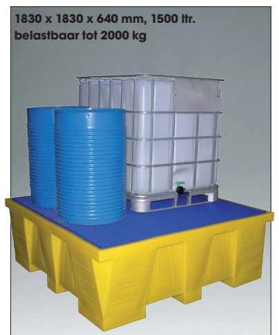
1830 x 1830 x 640 mm, 1500 ltr. belastbaar tot 2000 kg