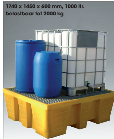
1740 x 1450 x 600 mm, 1000 ltr. belastbaar tot 2000 kg

Op de MRP SOUT 1100 is de afzul-unit geïntegreerd in de bak.