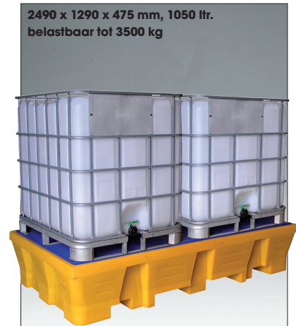
2490 x 1290 x 475 mm, 1050 ltr. belastbaar tot 3500 kg