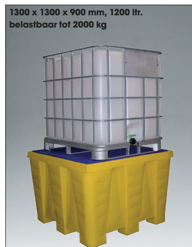
1300 x 1300 x 900 mm, 1200 ltr. belastbaar tot 2000 kg