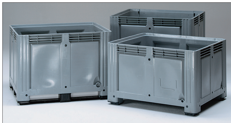
Maxiboxen, grotere volumes.

Maxiboxen (met bodemmaat van 1200 x 1000 mm) hebben 4 plaatsen waar een uitloop-stop of uitloopkraan kan worden gemonteerd; twee keer 1 duims op de lange en de korte zijde. Daar tegenover twee keer ½ duims.