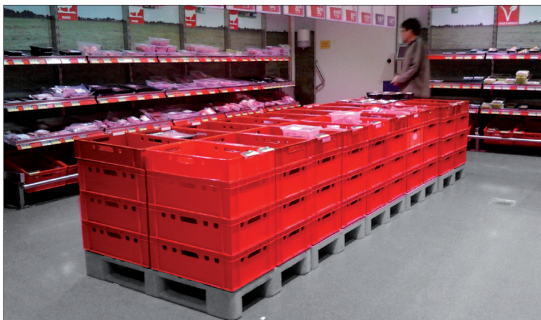
Euro vleeskratten en H1 pallets als display in een groothandel

Onderstaande Euro vleeskratten zijn de huidige standaard in de vleesverwerkende industrie. De open wanden en handvatten garanderen een goede luchtcirculatie. Eventueel water of condens blijft niet op de rand liggen.