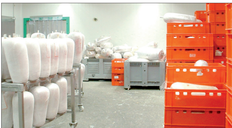
Euro vleeskratten en palletboxen in gebruik bij een vleesverwerker.