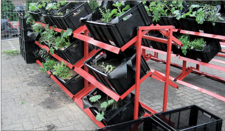
Kratjes in gebruik bij 'Natuursupermarkt' in Eindhoven.