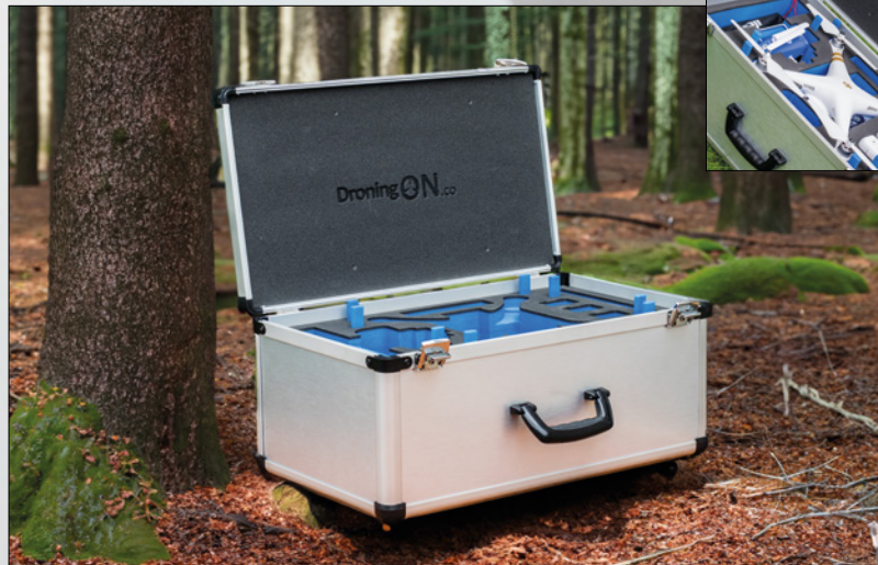
Protechnic Smartcase™ met een lichte drone erin.

Onze Protechnic Smartcases™ zijn in feite „lichte flightcases“. Ze bieden dezelfde flexibiliteit in ontwerp, maar met een slanker profiel en zijn eenvoudiger te dragen. Voor grotere producten waarbij stapelen noodzakelijk is voor opslag of transport, ontwerpen en produceren wij ook standaard flightcases. Naast opties zoals gekleurde of bedrukte panelen van stevig honingraatkunststof, leveren wij optioneel zwarte profielen en RVS handgrepen.