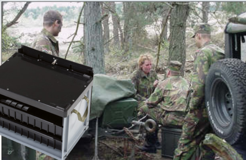
EHBO-koffer voor eerstelijnsgebruik.

Interieur met inschuifbare verdelers en een deksel met neopreen afdichting. Ontworpen voor administratieve taken in het veld.