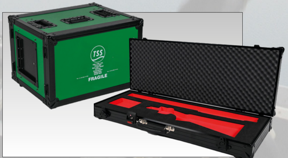
Klassieke flightcases, met een extra dimensie: meerkleurig schuim en zwarte accessoires.

De ATA (Air Transport Association) specificatie 300 wordt in de VS vaak als standaard voor koffers gebruikt. In Europa en de VS gelden verschillende DEF STAN- en MIL-SPEC-normen voor het transport van goederen voor militaire toepassingen. Ons ontwerpteam is goed op de hoogte van deze normen en zorgt ervoor dat onze koffers hieraan voldoen waar nodig.