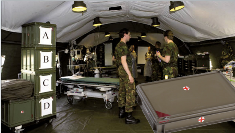
Normbox™ euronorm bak in een veldhospitaal. Niet alleen voor verbanden, maar ook voor flessen met lachgas.

Veldhospitaal en medische ondersteuning vereisen eveneens een aanzienlijke hoeveelheid verpakkingen. In vredetijd bouwen we onze voorraad op. Wanneer nodig, moeten verbanden, medicijnen en verdovingsmiddelen in grote hoeveelheden ter plaatse beschikbaar zijn, in goede staat en gemakkelijk toegankelijk. Engels Group kan opnieuw terugvallen op een schat aan ervaring. Op deze pagina vindt u een selectie van projecten uit ons portfolio.