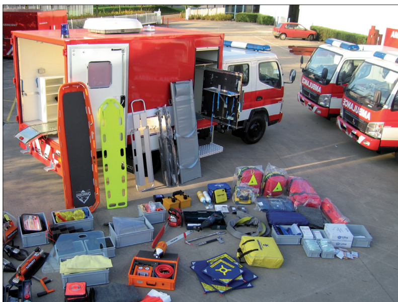
Inhoud reddingcontainer voor vervoer per vliegtuig.

Door hun uniforme inrichting kan personeel van ieder corps blind de benodigde spullen in een container van een ander corps vinden. Stress is onvermijdelijk bij rampenbestrijding. Maar naar de nodige gereedschappen zoeken, is geen stress meer. Zo blijft er meer concentratie over voor het verrichten van de taak. En daar ging het om.